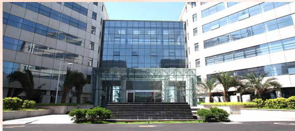
海南中化联合制药工业股份有限公司办公楼

公司于 2016 年 12 月 20 日召开第七届董事会第十五次会议，审议通过了收购海南中化联合制药工业股份有限公司的议案，交易价格为人民币 8.5 亿元。本次收购有利于公司实现业务布局和并购外延式增长；拓展治疗领域，在消化、抗病毒、抗肿瘤领域，依托海南中化现有大品种构建起全新的治疗平台；进一步丰富心脑血管领域产品线，与现有产品形成协同；增强招商代理客户资源和营销实力；进一步提高企业的竞争实力。